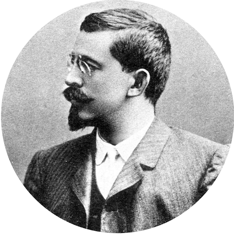
Yusuf Akçura, Kazan, 1906